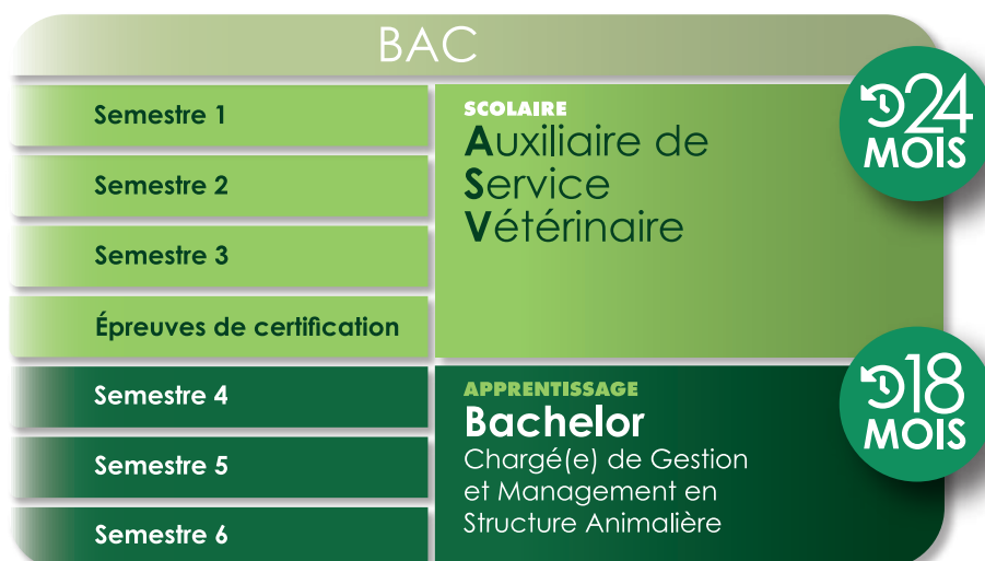
Schéma du parcours de formation

Benoît Salmon Directeur du réseau SUP-VÉTO